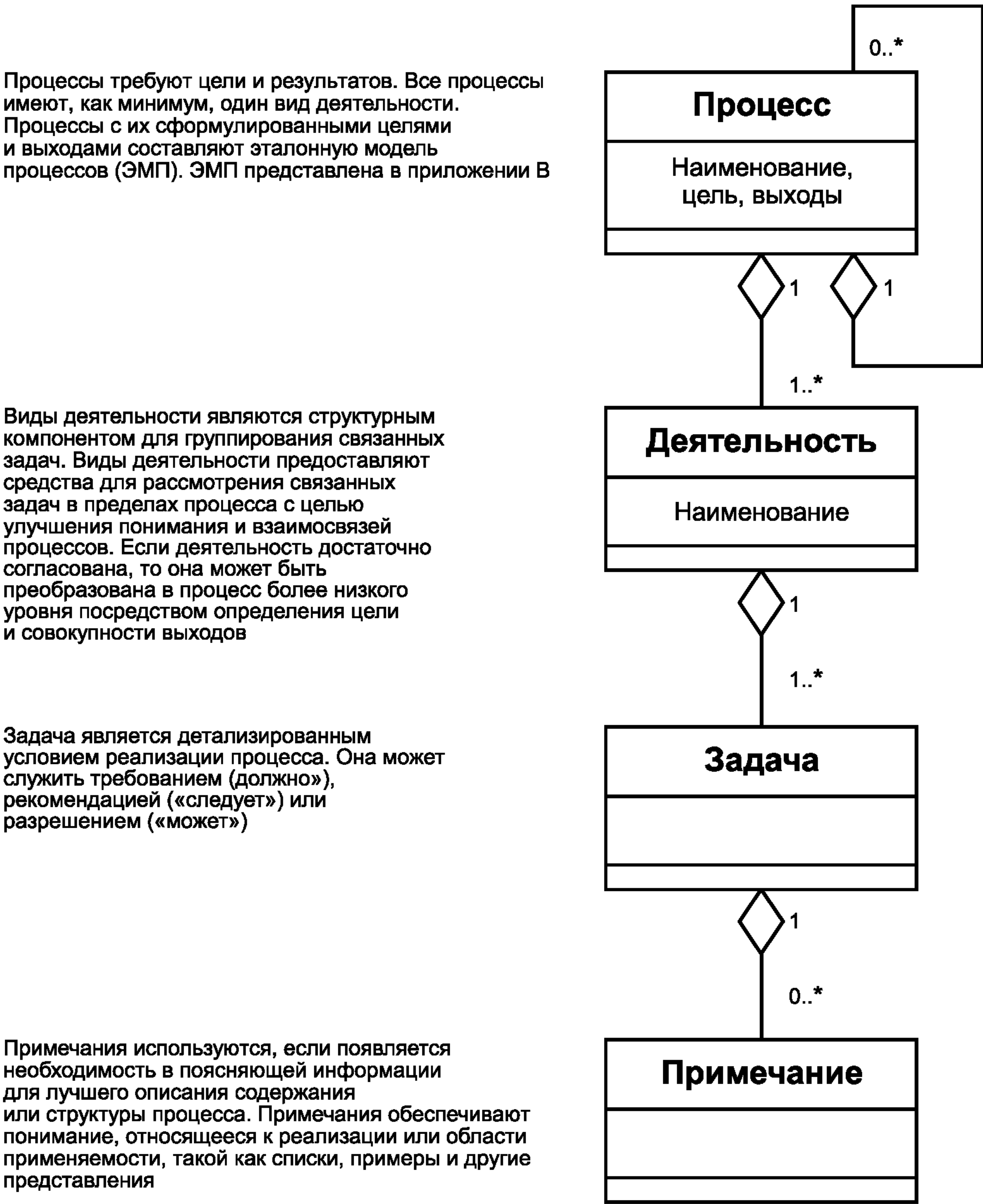
Рисунок С.1 — Конструкции процессов в ИСО/МЭК 12207 и ИСО/МЭК 15288

b) процессы организационного обеспечения проекта — пять процессов (см. 5.2.2.1.2 и 6.2); c) процессы проекта — семь процессов (см. 5.2.2.1.3 и 6.3); d) технические процессы — одиннадцать процессов (см. 5.2.2.1.4 и 6.4); e) процессы реализации программных средств — семь процессов (см. 5.2.2.2.и 7.1); f) процессы поддержки программных средств — восемь процессов (см. 5.2.2.2.2 и 7.2); g) процессы повторного применения программных средств — три процесса (см. 5.2.2.2.3 и 7.3). Последовательное использование правил описания процессов позволяет получить нормализованную нумерацию разделения стандарта на подразделы, пункты, подпункты и т. д. В пределах настоящего стандарта: 6.a и 7.a — указывают на группу процесса; 6.a.b и 7.a.b — указывают на процесс (или процессы более низкого уровня) в пределах этой группы; 6.a.b.1 и 7.a.b.1 — описывают цель процесса; 6.a.b.2 и 7.a.b.2 — описывают выходы процесса; 6.a.b.3.c и 7.a.b.3.c — перечисляют виды деятельности в рамках процесса и пункты; 6.a.b.3.c.d и 7.a.b.3.c.d — перечисляют задачи вида деятельности «с». Представление конструкций процессов на универсальном языке моделирования UML, применяемых в настоящем стандарте и ИСО/МЭК 15288—2007, показано на рисунке С.1.